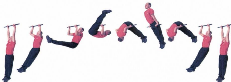
Рис. 4. Подъём переворотом на перекладине

Вис на перекладине (хват сверху, руки и тело прямые, ноги вместе, положение тела неподвижное), сгибая руки и поднимая ноги к перекладине, выполнить переворот вокруг грифа, принять упор на прямые руки, опуститься в вис произвольным способом. Положение упора фиксируется не менее 1 секунды. Положение виса фиксируется не менее 1 секунды (продолжить движение после объявления счета). Разрешается разведение ног до ширины плеч и незначительное сгибание ног в коленных суставах. Выполнение упражнения махом, касание подбородком перекладины, отдых в положении упора и на животе, согнувшись на грифе, не допускаются. Упражнение выполняется в спортивной форме одежды по команде «К СНАРЯДУ». При нарушении условий выполнения упражнения повторение не засчитывается, подаётся команда «НЕ СЧИТАТЬ».