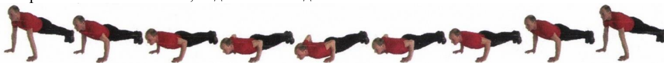
Рис. 1. Сгибание и разгибание рук в упоре лёжа

Положение упора лёжа фиксировать не менее 1 секунды (продолжить движение после объявления счета). Разводить ноги, сгибание тела и ног, отдых в положении упора лёжа на согнутых руках не допускается. Упражнение выполняется в спортивной форме одежды по команде «К выполнению упражнения ПРИСТУПИТЬ». При нарушении условий выполнения упражнения повторение не засчитывается, подаётся команда «НЕ СЧИТАТЬ».