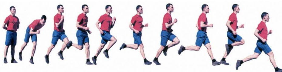
Рис. 9. Бег на 400 м

Упражнение выполняется в спортивной форме одежды с высокого старта по беговой дорожке стадиона или ровной площадке с любым пригодным покрытием. По команде «НА СТАРТ» подойти к стартовой линии, поставить одну ногу вперёд, не наступая на линию, другую отставить назад. По команде «ВНИМАНИЕ» принять неподвижное положение старта. По команде «МАРШ!» начать бег. Создание помех другому гражданину, начало бега раньше команды «МАРШ!» (фальстарт) не допускаются.