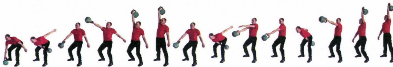
Рис. 6. Рывок гири

«К СНАРЯДУ». При нарушении условий выполнения упражнения повторение не засчитывается, подаётся команда «НЕ СЧИТАТЬ».