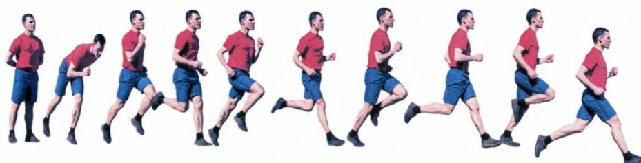
Рис. 10. Бег на 1 км, бег на 3 км

Упражнения выполняются в спортивной форме одежды на беговой дорожке стадиона или ровной дороге вне стадиона с общего старта. По команде «НА СТАРТ» подойти к стартовой линии, по команде «МАРШ!» начать бег. Старт и финиш, как правило, оборудуются в одном месте. При выполнении упражнений на беговой дорожке стадиона старт и финиш производится в соответствии с разметкой стадиона.