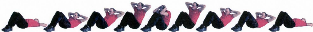
Рис. 2. Наклон туловища вперед

Лежа на спине с согнутыми ногами (руки за голову, пальцы в «замок»), ноги согнуты, ступни прижаты к полу, лопатки касаются пола), наклонить туловище вперед до касания локтями коленей и возвратиться в положение лёжа на спине с согнутыми ногами (продолжить движение после объявления счета). Упражнение выполняется в течение одной минуты. Разрешается фиксировать ноги за голеностопы руками партнера. Отрыв ступней от опорной поверхности (пола) не допускается. Упражнение выполняется в спортивной форме одежды по команде «К выполнению упражнения ПРИСТУПИТЬ». При нарушении условий выполнения упражнения повторение не засчитывается, подаётся команда «НЕ СЧИТАТЬ».