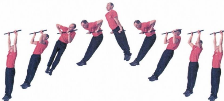
Рис. 5. Подъём силой на перекладине

Вис на перекладине (хват сверху, руки и тело прямые, ноги вместе, положение тела неподвижное), сгибая руки, поставить в упор сначала одну согнутую руку, затем – другую или обе руки одновременно, разгибая руки принять положение упора на прямых руках, опуститься в вис произвольным способом. Положение упора фиксируется не менее 1 секунды. Положение виса фиксируется не менее 1 секунды (продолжить движение после объявления счета). Разрешается выходить в упор на обе руки одновременно. Выполнение упражнения махом, отдых в положении упора и лежа на животе, согнувшись на грифе, не допускаются. Упражнение выполняется в спортивной форме одежды по команде «К СНАРЯДУ». При нарушении условий выполнения упражнения повторение не засчитывается, подаётся команда «НЕ СЧИТАТЬ».