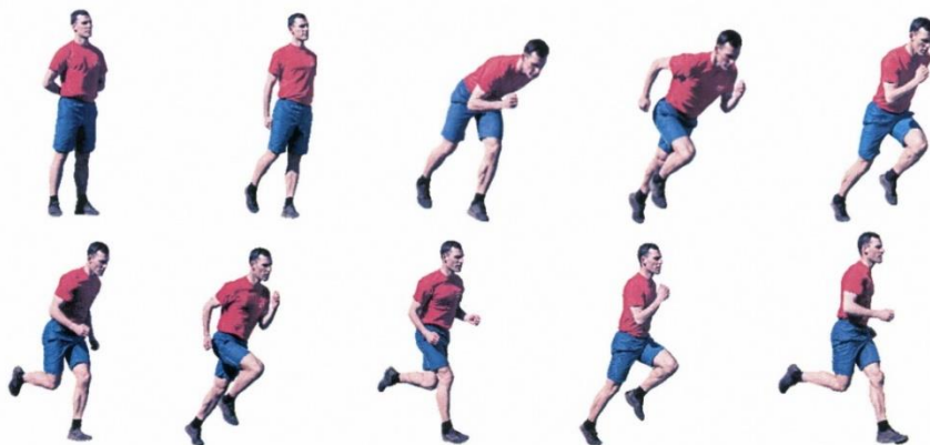
Рис. 7. Бег на 60 м, бег на 100 м

Упражнения выполняются в спортивной форме одежды с высокого старта по беговой дорожке стадиона или ровной площадке с любым пригодным покрытием. По команде «НА СТАРТ» подойти к стартовой линии, поставить одну ногу вперед, не наступая на линию, другую отставить назад. По команде «ВНИМАНИЕ» принять неподвижное положение старта. По команде «МАРШ!» начать бег. Пересечение соседней дорожки, создание помехи другим гражданам, начало бега раньше команды «МАРШ!» (фальстарт) не допускаются. При нарушении условий выполнения упражнений предоставляется вторая попытка, при повторном нарушении упражнение считается невыполненным.