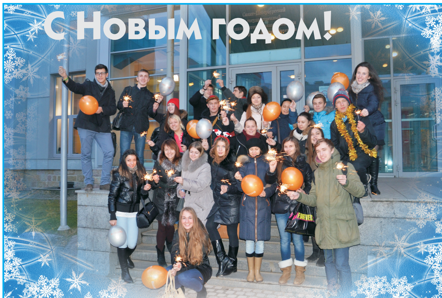
Студенты факультетов ГФ и ИКСС — победители «Кубка ректора — 2013»