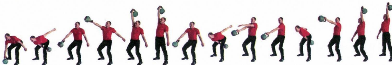
Рис. 6. Рывок гири