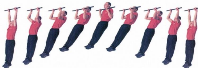
Рис. 3. Подтягивание на перекладине

Упражнение выполняется в спортивной форме одежды по команде «К СНАРЯДУ». При нарушении условий выполнения упражнения повторение не засчитывается, подаётся команда «НЕ СЧИТАТЬ».