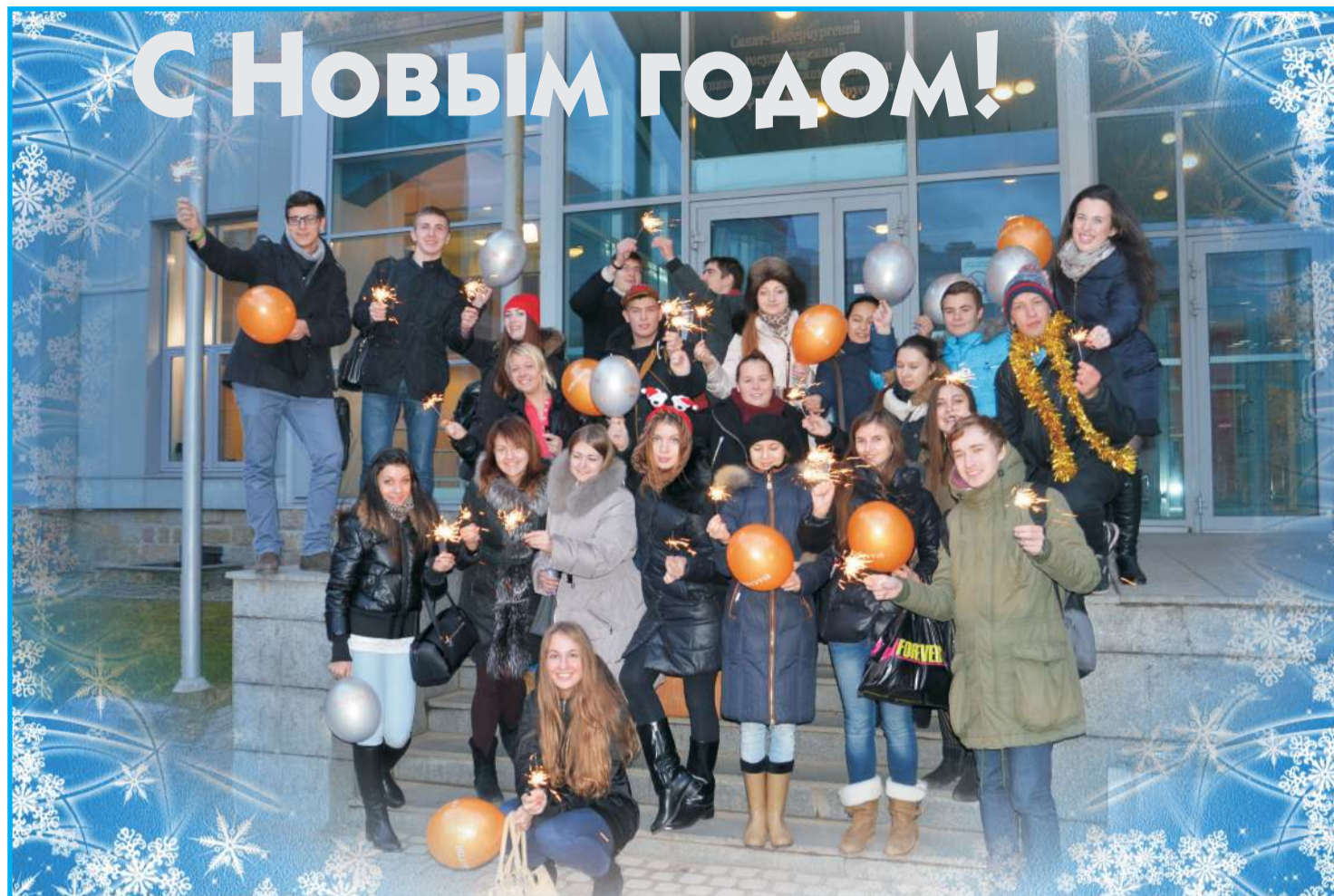
Студенты факультетов ГФ и ИКСС – победители «Кубка ректора – 2013»